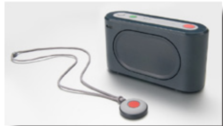
Careline Anna / IP

Zowel met SafeBed als SafeFloor is het mogelijk de zorgverlener betrouwbaar en draadloos over lange afstand te alarmeren via het GSM netwerk. In de apparatuur is een GSM telefoonmodule ingebouwd. Alarmnummers zijn opgeslagen op de SIM kaart die in het alarmtoestel wordt gedaan.