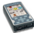
GEWA Control Omni