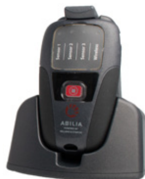
All in One pager