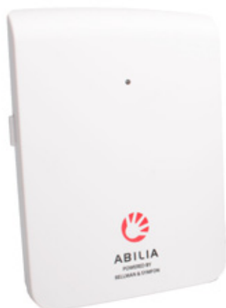
All in One centrale unit

Let op! De apparatuur is geen medisch hulpmiddel of vervanging voor menselijk toezicht. Persoonlijk toezicht blijft noodzakelijk.