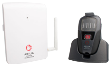
All in One

De sensor geeft een signaal naar de pieper. De Emfit monitor heeft een hoorbaar alarm met instelbaar volume en een relaisuitvoer voor aansluiting op het zusteroproep- of personenalarmsysteem en kan ook gecombineerd worden met een partner- / of personenoproep zoals de All in One of CL IP/GSM.